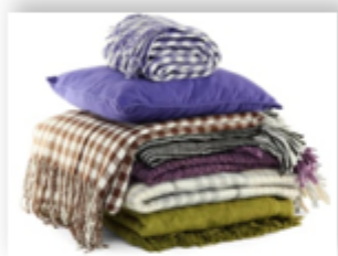
Maishiy to'qimachilik mahsulotlari 2,3 %