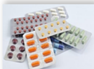
Dori-darmonlar 1,7 %