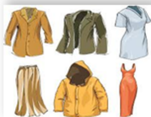
Kiyim 3,1 %

Nooziq-ovqat mahsulotlari narxlarining umumiy o'sishda 75,0 %ni quyidagi mahsulotlar hisobiga ro'y berdi: