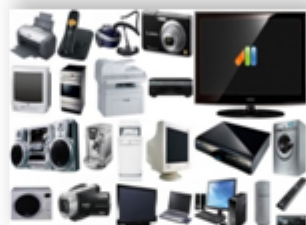
Madaniy mollar 1,7 %