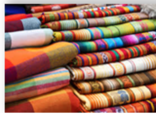
Gazlama va eshilgan iplar 1,2 %