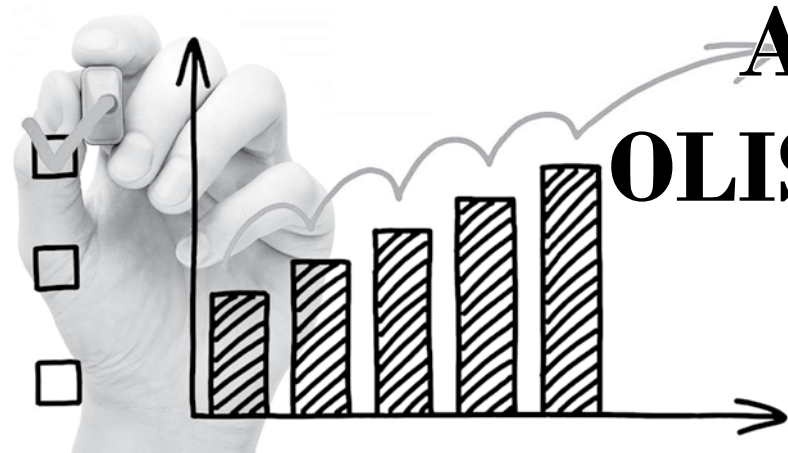
AHOLI ASOSAN QUYIDAGI MAQSADLARDA RO'YXATGA OLINADI:

O'ZA muxbiri Nasiba ZIYODULLAYEVA yozib oldi.