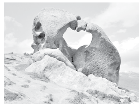
Камень-сердце со сквозным отверстием находится в 30 километрах к югу от Самарканда, вблизи поселка Каратепе. Огромный валун часто называют «Динозавром» за особую форму.