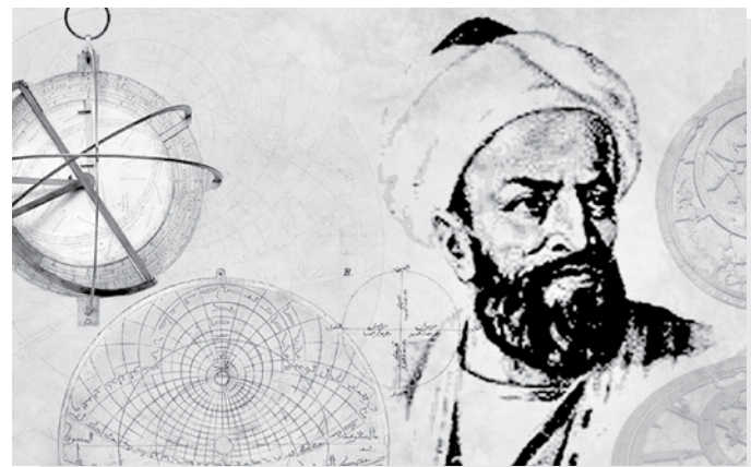
Трактат Абу Райхана Беруни, написанный в 1037 году, считается первой энциклопедией по астрономии.